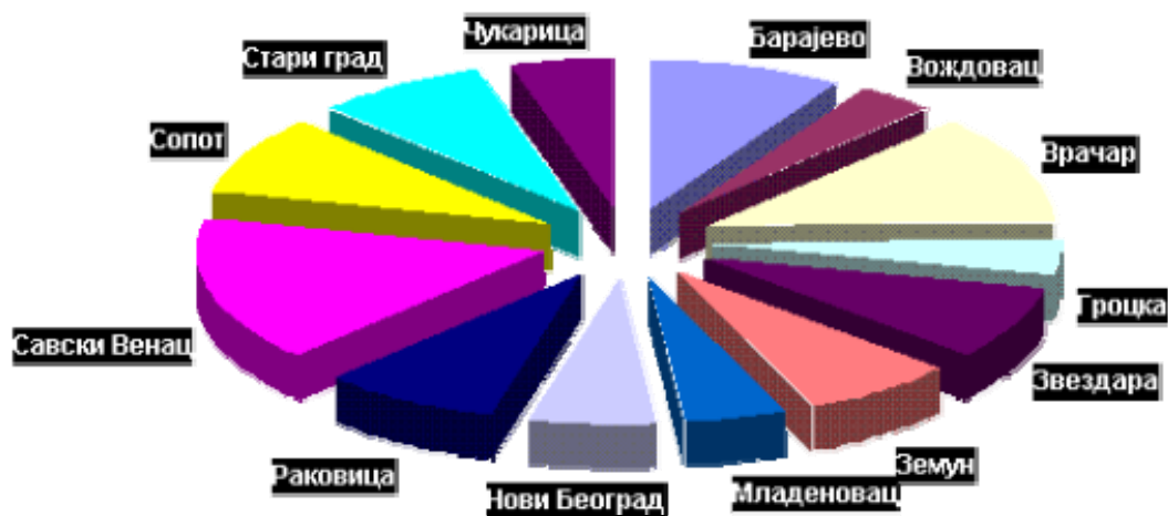
Процент становништва општине уписаног у библиотеку