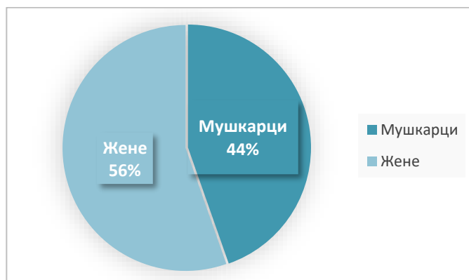
Графикон 2: Чланови Библиотеке према полу

Посматрано према полу, већи број чланова Библиотеке чине жене, којих је укупно 73.776 (55.64%), док је мушкараца 58.819 (44.36%).